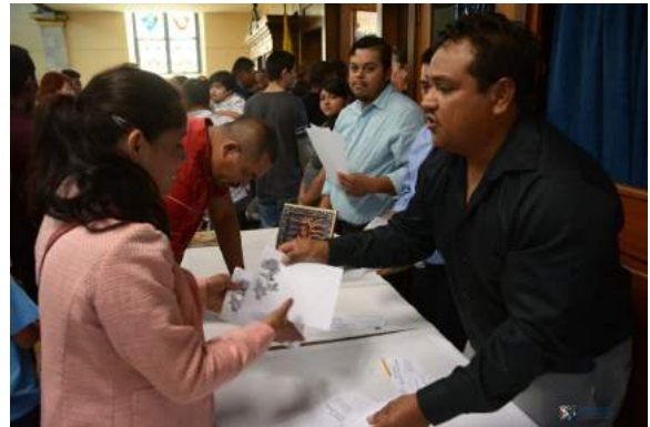
CLASES PRE-BAUTISMALES Next baptism class Domingo 20 de Noviembre - 3:00pm