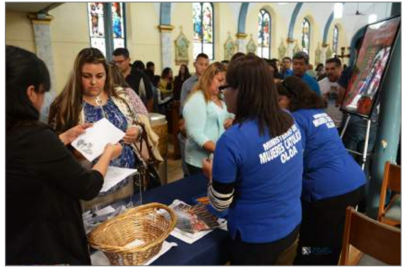
En plena acción Mujeres Católicas y Caballeros de Colón.