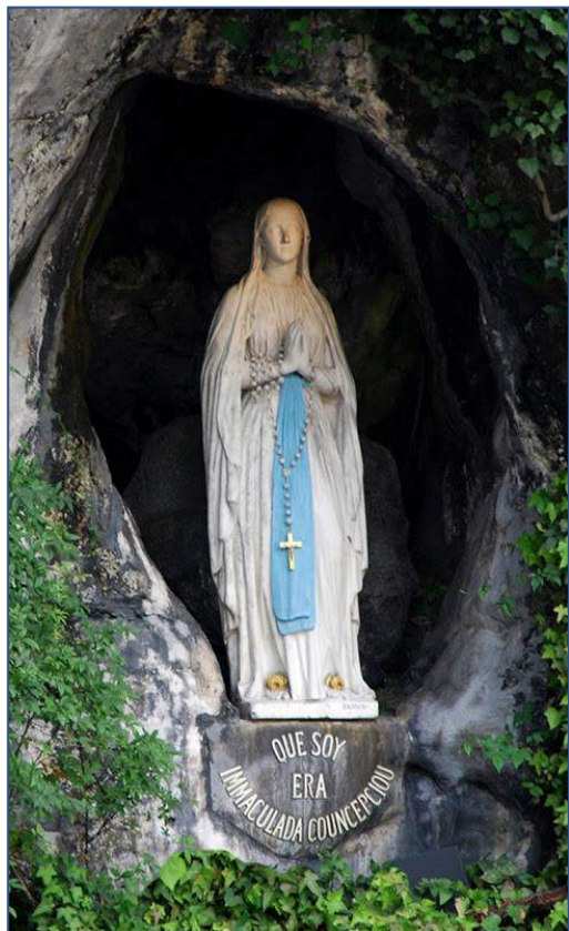
Lourdes , 11 Febrero

leave your gift there at the altar, go first and be reconciled with your brother!