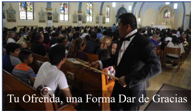
Tu Ofrenda, una Forma Dar de Gracias