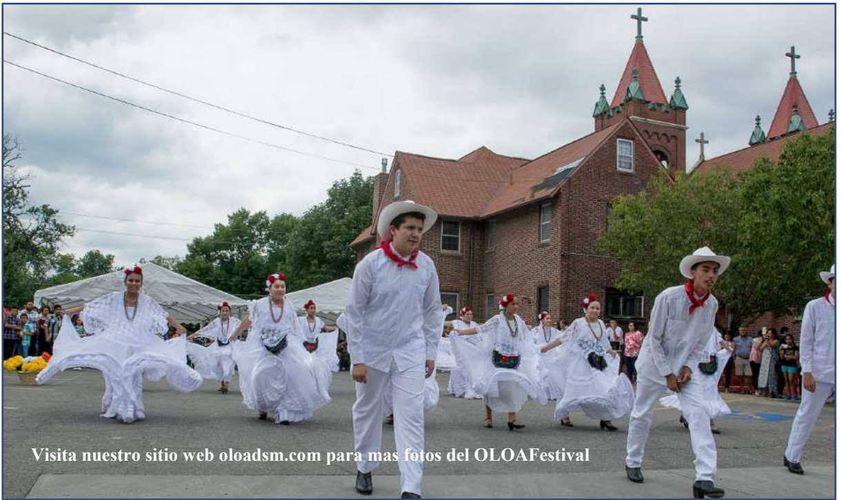
Visita nuestro sitio web oloadsm.com para mas fotos del OLOAFestival