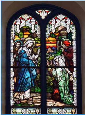
Ventana de la Visitación, lado norte de nuestro Templo

E l 31 de Mayo la Iglesia celebra la Fiesta de la Visitación de la Santísima Virgen María. Con esta fiesta la Iglesia cierra el mes de Mayo, mes consagrado a la Virgen. Este episodio que hace referencia a la visita que hizo María a su prima Isabel nos muestra su manera de ser amable, una guía de inspiración para ser discípulo y en el que surgen dos de los más hermosos cantos de alabanza: la segunda parte del Avemaría y el canto del Magnificat.